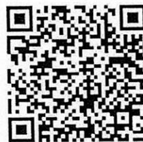
ใบสำคัญรับเงิน