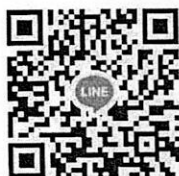
กลุ่มประสานงาน

***ให้สแกน QR Code เพื่อรับข่าวสารทาง Line ผ่านทางกลุ่มประสานงานโครงการให้ความช่วยเหลือค่าใช้จ่ายที่จำเป็นในการศึกษาของนักเรียนฯ อีกหนึ่งช่องทาง